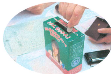
ダメ・ゼッタイ募金