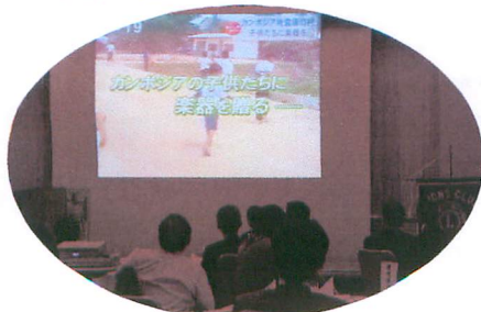
カンボジアの子供達への楽器贈呈に対し カンボジア・バタンバン州教育長からより感謝状の拝受