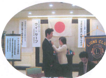
松山白鷺ライオンズクラブに入会して