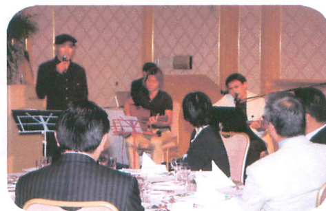
コンサート 平成教育委員会