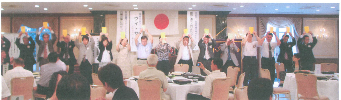
新年度役員紹介並びにバッジ引き継ぎ