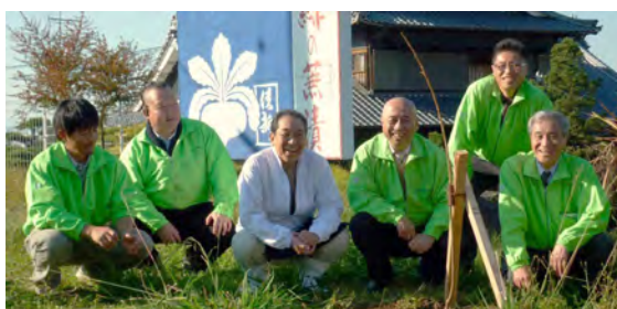
20 期 陽光桜 植樹