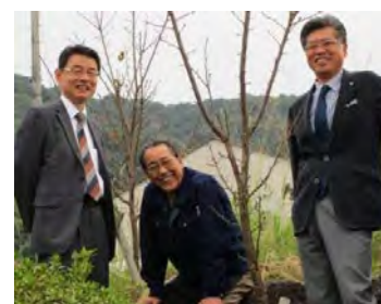
25 期 11 月 陽光桜に会いに行く