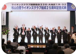
クラブ内表彰 チャーターメンバー