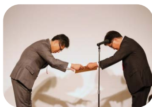
記念事業目録贈呈