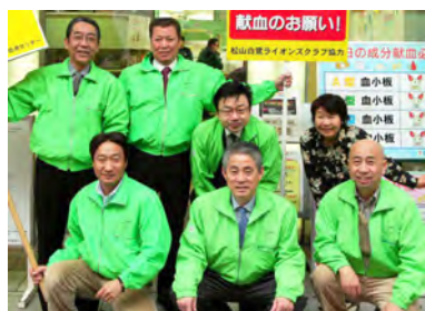
19 期 献血