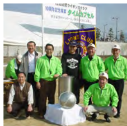
10 期 タイムカプセル