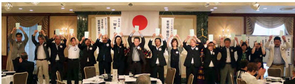
役員バッジの引き継ぎ