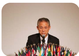
開会の言葉 二宮25周年実行委員長