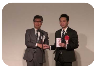
スポンサークラブへ 記念品贈呈