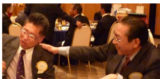
20 期 姫路 50 周年記念式典