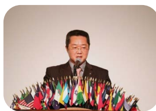
閉会の言葉 北川第1副会長