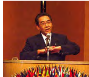
15 期 例会卓話